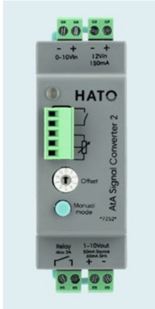
ATA signal Converter 2