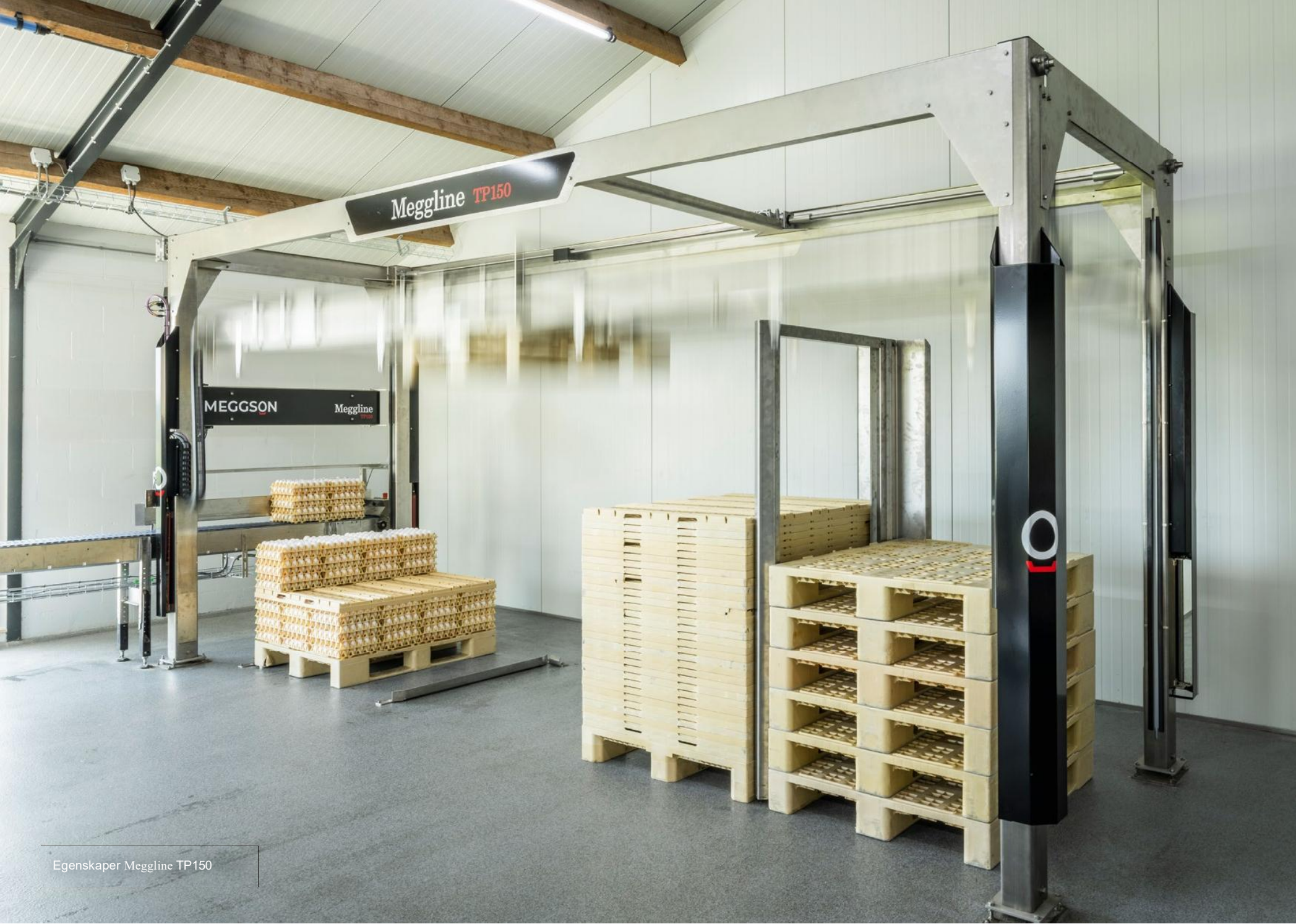
Egenskaper Meggline TP150